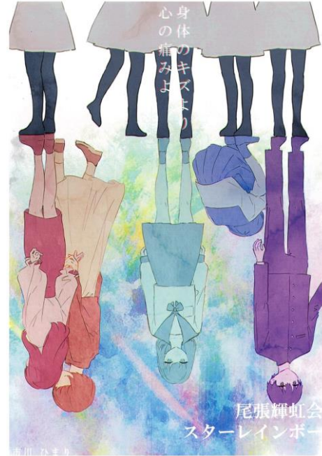
ポスター最優秀賞作品