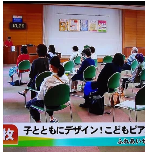
牧 子とともにデザイン!こどもピア ふれあいせ