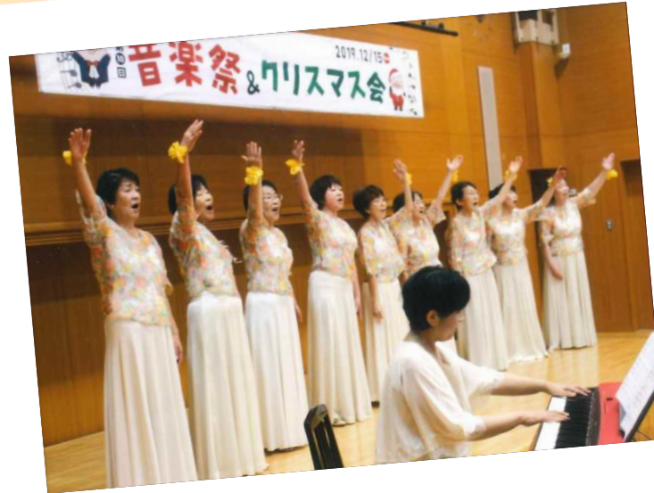
2019年 音楽祭&クリスマス会