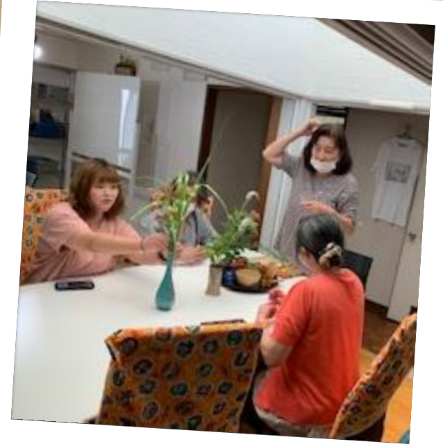
視覚障がい者のための茶道