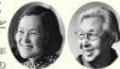
いわさきちひろ 平塚らいてう

1963～働く女性が唱えるなか、30歳定年 制や結婚退職制なくせ、「ポストの 数ほど保育所を」と各地で運動