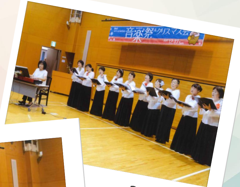
2017年 音楽祭&クリスマス会