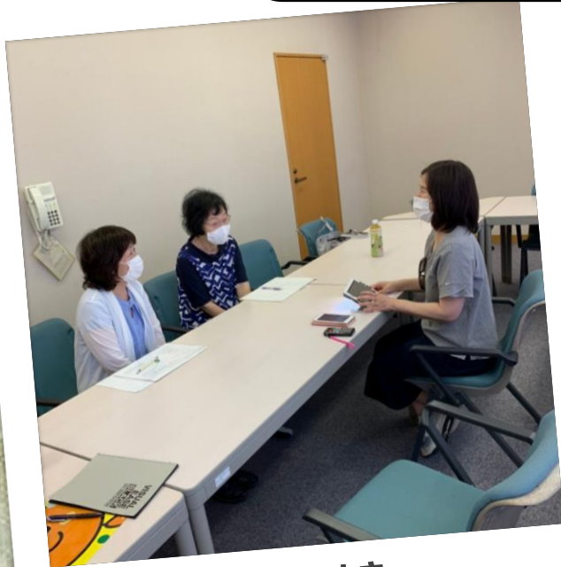
ぶらこまき かっこうインタビュー

視覚障がい者だけでなく市民の方が参加できるiPhone講座 やイベントを行っています。お気軽に参加して下さい。