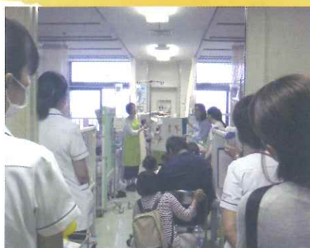
<5月2日市民病院読み聞かせ会>

よみかせ隊「このゆびとまれ」は小牧市との協働事業として、「入院中の小児患者に対するふれあい事業」を行っています。絵本の読み聞かせをすることで、病気やケガの治療で出かけられない子どもにも本に親しむ機会を作りたい、そして健やかに成長してほしいとの思いで活動しています。