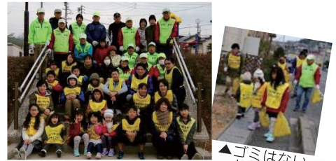
▲作業後のさわやかな笑顔

また小牧市主催の「小牧山美化活動」や「ごみ散乱防止市民活動の日小牧まち美化ウォーク」にも協力しています。