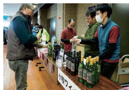
▲わがまちの逸品販売で信長ワインを販売する、障がい者就労支援施設「小牧ワイナリー」