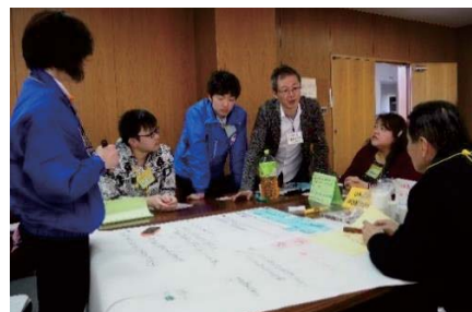
▲「まちの魅力を広めよう」をテーマに意見交換を行う参加者

参加者からは「近隣市町の新たな発見をすることができた」「他地域の人の考え方が分かった」などの意見が聞かれ、日ごろ交流する機会の少ない人や団体が出会い、市町を超えた新たな連携へとつながる機会となりました。来年度は、豊山町での開催を予定しています。