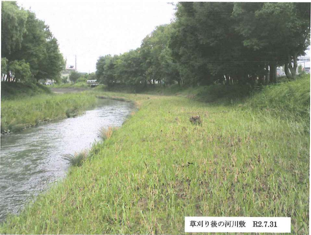
草刈り後の河川敷 R2.7.31